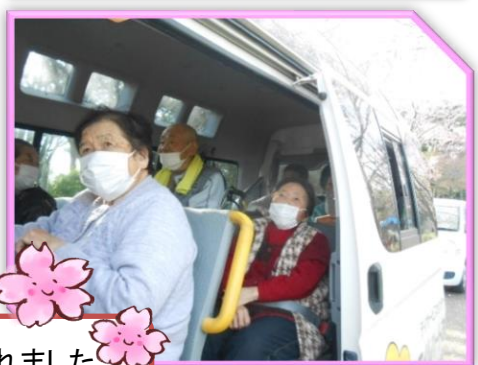
車内からでもきれいなお花が見られました