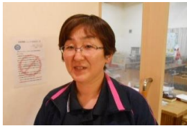
看護師・機能訓練指導員 大槻 女子 笑顔 ヘビ ローテーションで 幸せが巡る1年にして いきましょう！